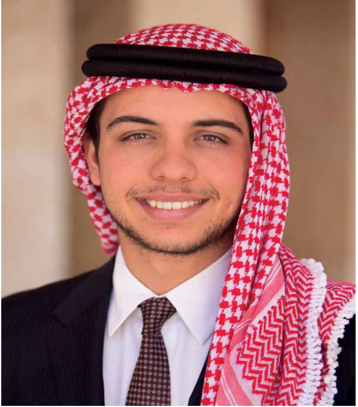
صاحب السمو الملكي الأمير الحسين ابن عبد الله ولي العهد المعظم