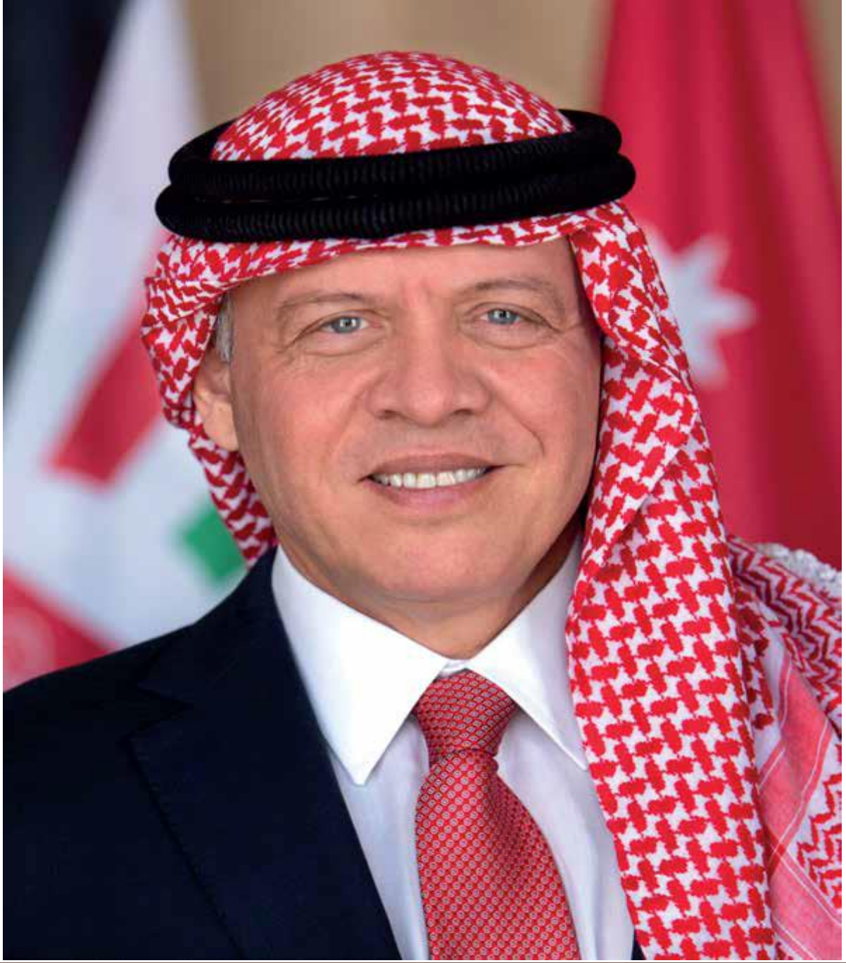
صاحب الجلالة الهاشمية الملك عبد الله الثاني ابن الحسين المعظم